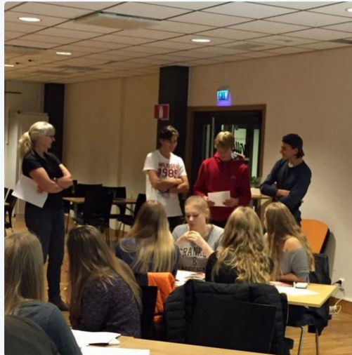
Viktor Bergkvist @ViktorBergkvist · 2 nov. 2015 Kostföreläsning i 16 till A-lag samt grupparbete med tillhörande presentation inför grupp, viktigt! #madebyilisch